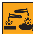
C - Corrosif