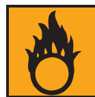
O - Comburant