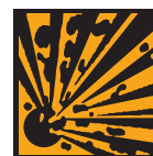
E - Explosif