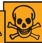
T - Toxique