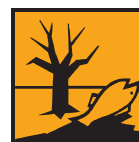
N - Dangereux pour l'environnement