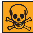
T+ - Très toxique