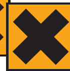
Xn - Nocif