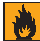
F - Facilement inflammable