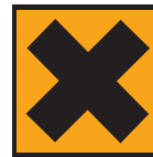
Xi - Irritant